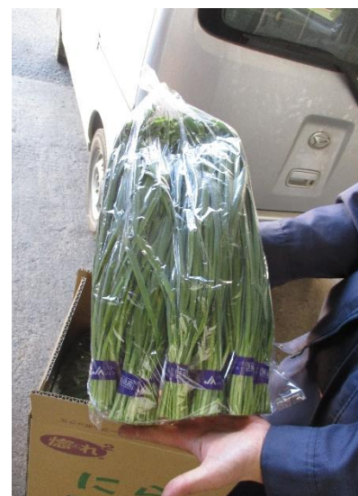
⑨ 1袋10束、1箱4袋入りにして出荷です。