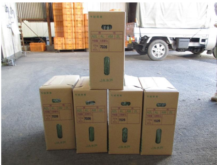
⑩ 初出荷は5ケースと少し少なめです。