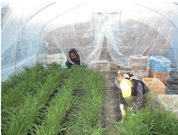
⑦ 刈り捨てから3週間程度で収穫です。