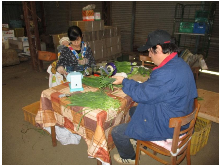
⑧ 出荷調整中です。この作業が一番時間がかかります。