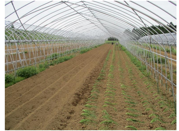
③ 6月に定植しました。