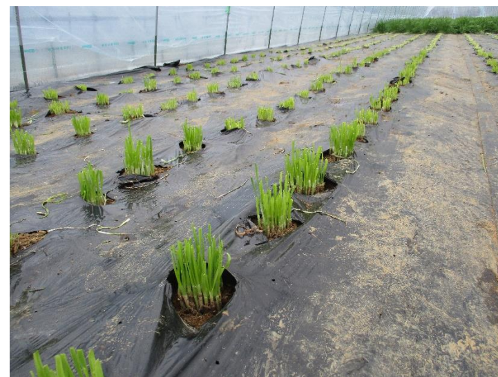
⑫ 刈り取り後3日程度で次のニラが芽吹いてきてます。