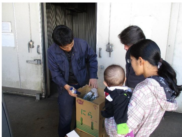
⑪ 農協職員の検品です。赤ちゃんも不安そうに見つめています。無事通りました。