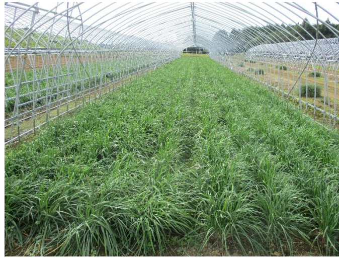
⑤ 刈り捨て直前。かなり大きくなりました。