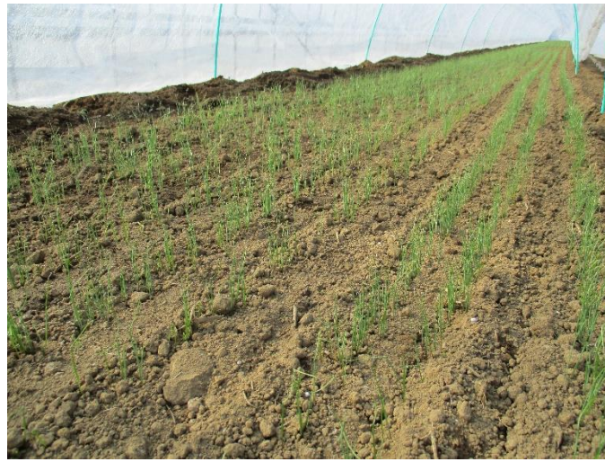
② 1週間程度で芽が出ます。