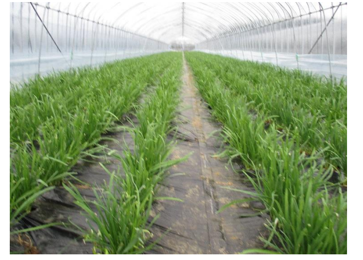
⑥ 刈り捨て後、ビニールをかけて育成中。